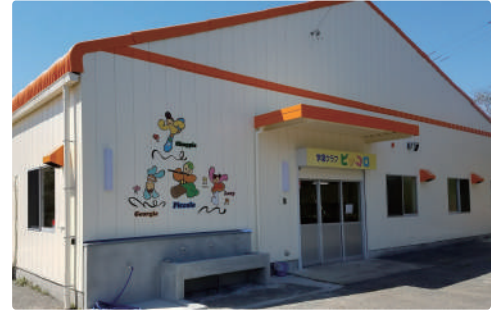
学童保育 学童クラブ ピッコロ チャレンジ友遊学舎