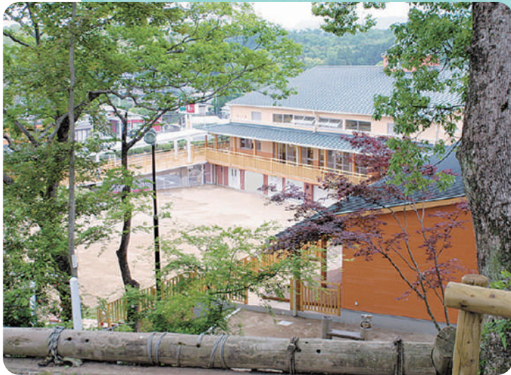
幼稚園・保育園総合施設 おおくらの森幼稚園 おおくらの森保育園

また、様々な世代の生活支援機関として、松本学園グループは、さまざまな若者サポートステーション、熊本県子ども・若者総合相談センター等を受託しています。