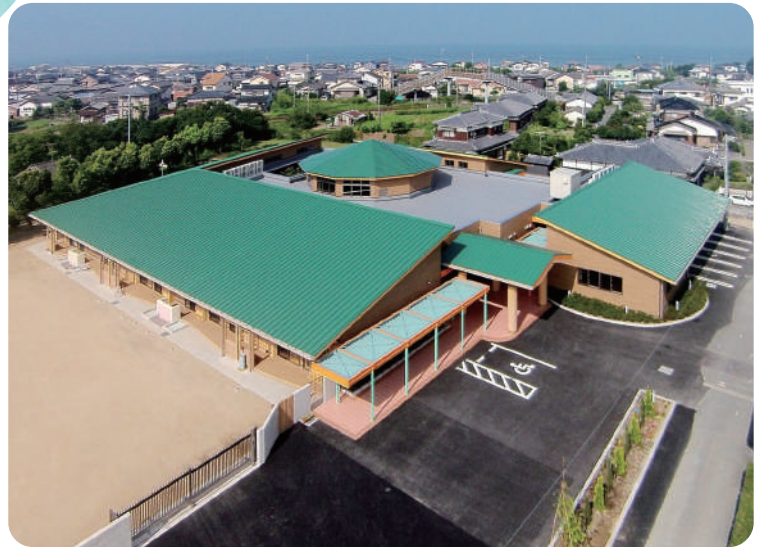
幼保連携型認定こども園 (旧長洲幼稚園、長洲保育所) 長洲しおかぜこども園