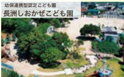
幼保連携型認定こども園 長洲しおかぜこども園