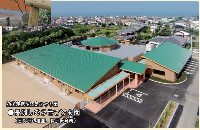
幼保連携型認定こども園 ●長洲しおかぜこども園 (旧長洲幼稚園、長洲保育所)