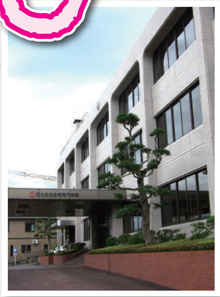
※オープンキャンパス日以外でも 随時学校見学は受け付けております！