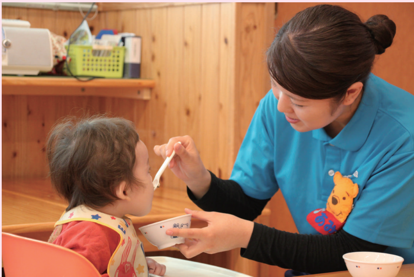
附属園での実習風景

保育や幼児教育に関する専門的な知識を身につけ、 即戦力として活躍できる保育士・幼稚園教諭を養成