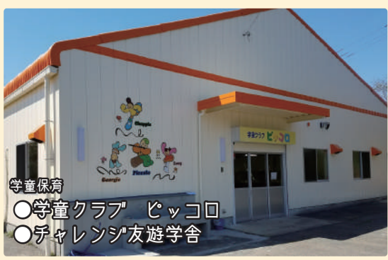
学童保育 ●学童クラブ ビッコロ ●チャレンジ友遊学舎