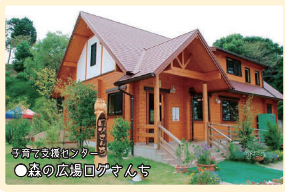
子育て支援センター ●森の広場ロケマンち