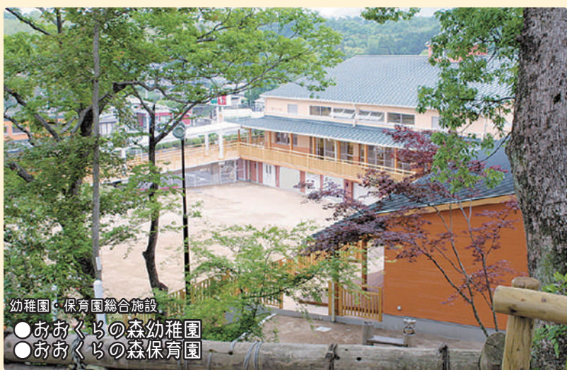
幼稚園・保育園総合施設 ●おおくらの森幼稚園 ●おおくらの森保育園

また、様々な世代の生活支援機関として、松本学園グループは、たまな若者サポートステーション、熊本県子ども・若者総合相談センター等を受託しています。