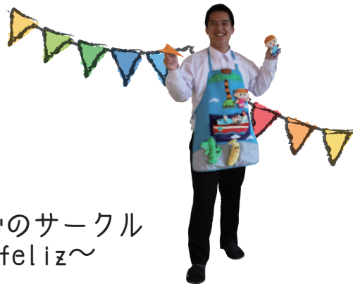
あそびのサークル ～feliz～

私がこの学校を選んで決め手となった一番の理由はオープンキャンパスです！オープンキャンパスに参加してまず思ったことは、学校の雰囲気が良いということです。