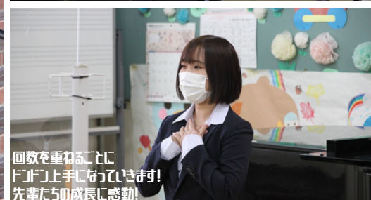
回数を重ねるごとに ドンドン上手になっていきます! 先輩たちの成長に感動!