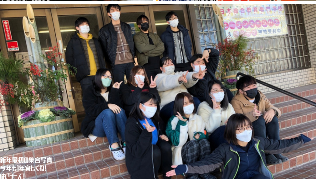
新年最初の集合写真 今年も年宜しくね! はーいーす!