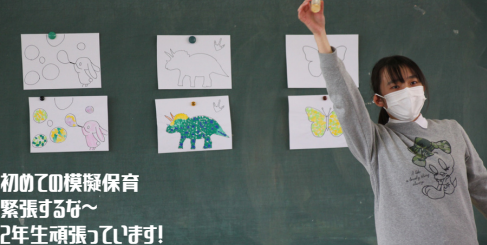
初めての模擬保育 緊張するな～ 2年生頑張っています!