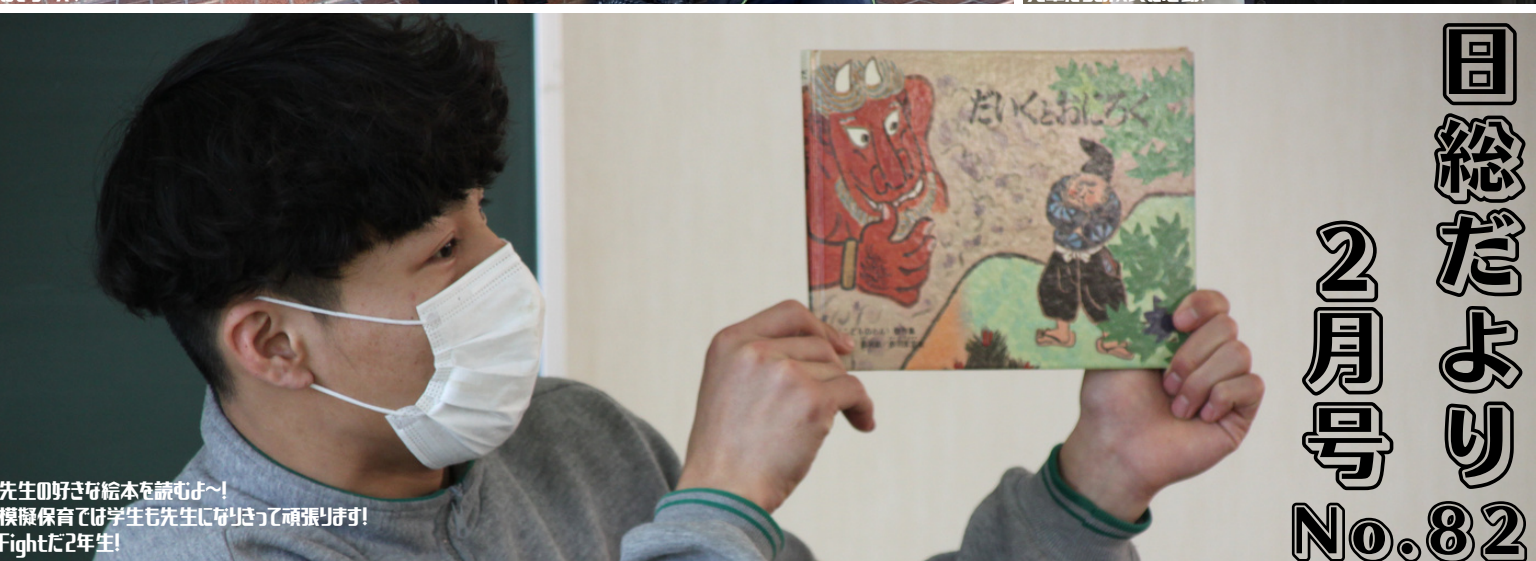
先生の好きな絵本を読むよ～! 模擬保育では学生も先生になりきって頑張ります! Fightだ2年生!