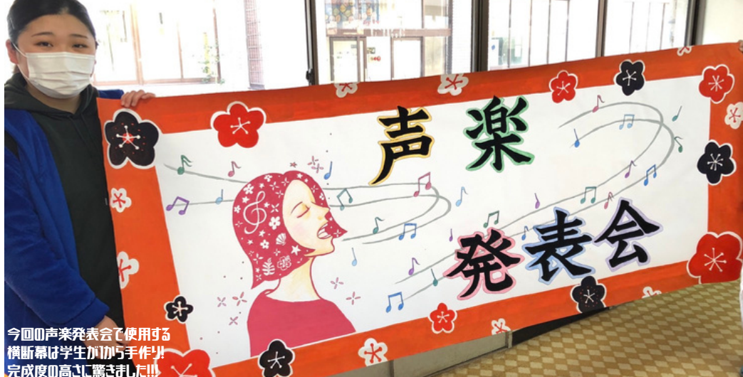
今回の音楽発表会で使用する 横断幕は学生がから手作り!! 完成度の高さに驚きました!!!