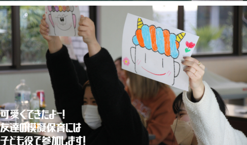
可愛くてきたよ! 友達や模擬保育には 子ども役で参加します!