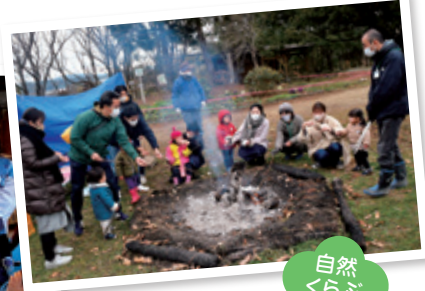
自然 くらぶ (焚き火)