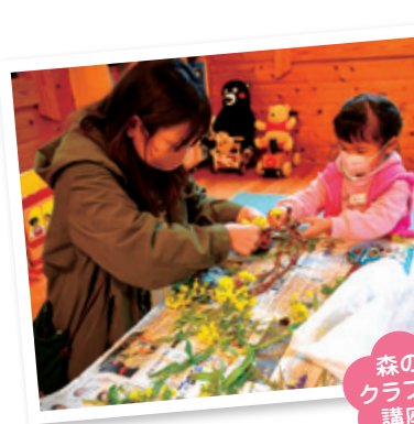
森の クラフト 講座