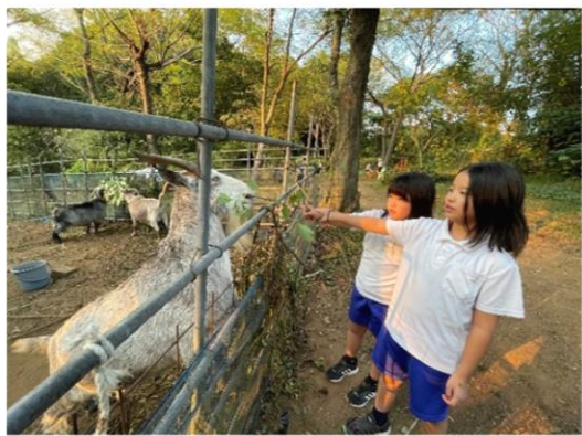
ヤギさんに葉っぱをあげる