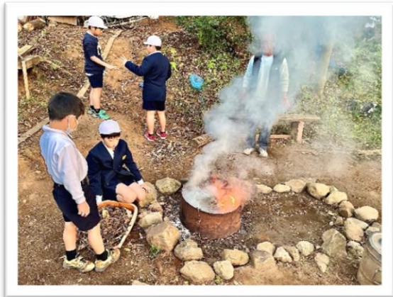
たき火の周りでおしゃべり

子どもたちは、寒さに負けず外でドッジボールをしたり、長縄を使って八の字や全員で何回跳べるかチャレンジして元気に体を動かしたり、子どもたちはそれぞれの場所で、友だちと一緒に楽しそうに過ごしています。