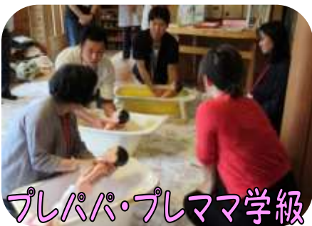
プレパパ・プレママ学級