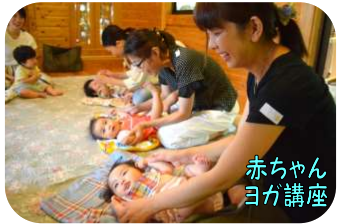
赤ちゃん ヨガ講座