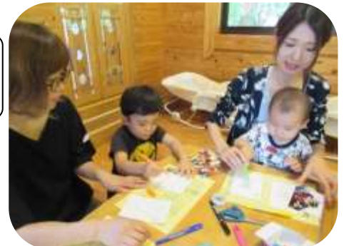
敬老の日のプレゼント作り