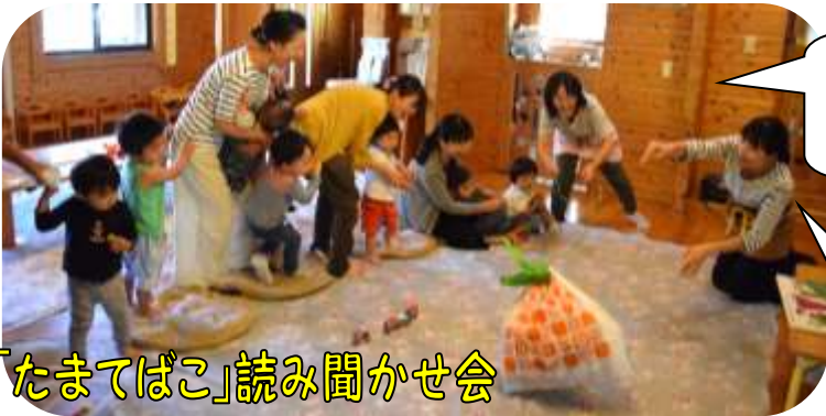
「たまたばこ」読み聞かせ会