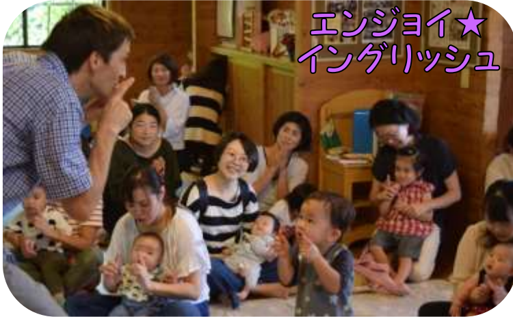
エンジョイ★ イングリッシュ