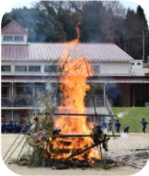
どんどや・もぐらうち