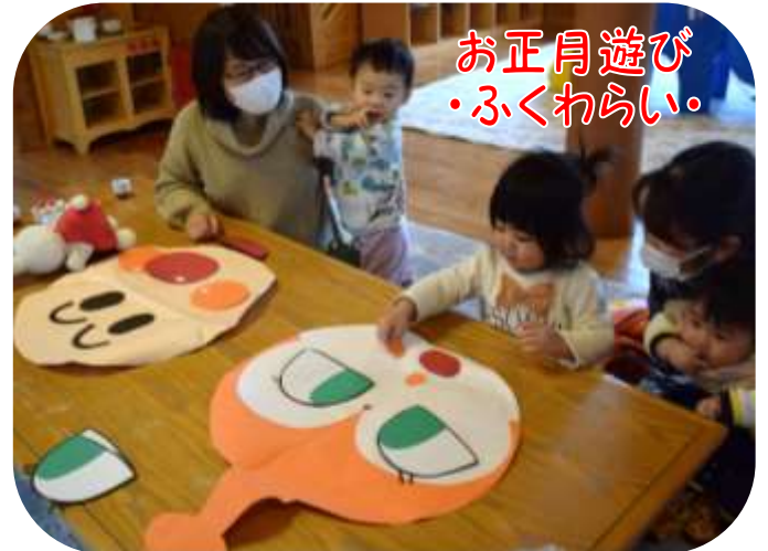
お正月遊び ・ふくわらい・