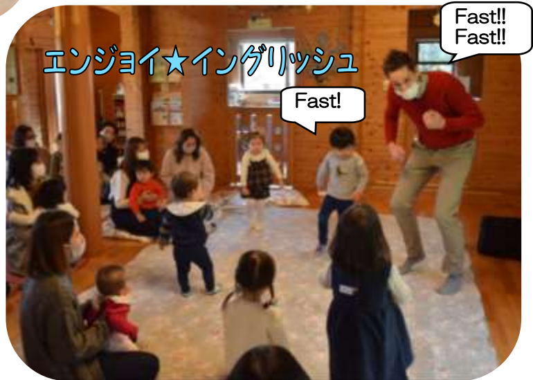
エンジョイ★イングリッシュ