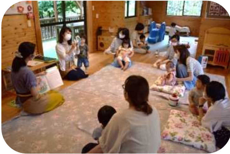
「たまてばこ」読み聞かせ会