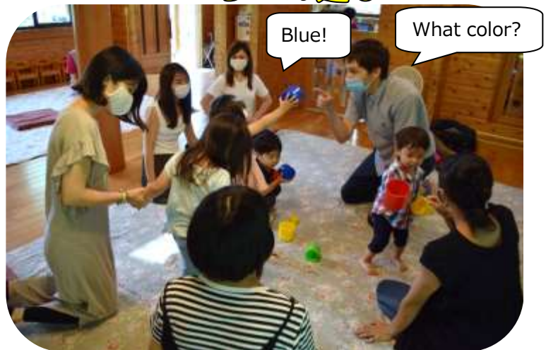
エンジョイ☆イングリッシュ

【発行元】森のひろば ログさんち 玉名市大倉 1503-1 Tel/Fax 0968-74-6931