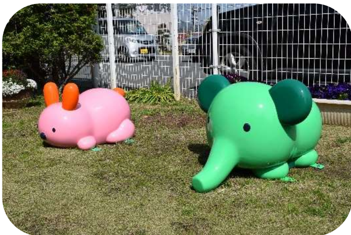
そうとうさぎも待ってるよ★