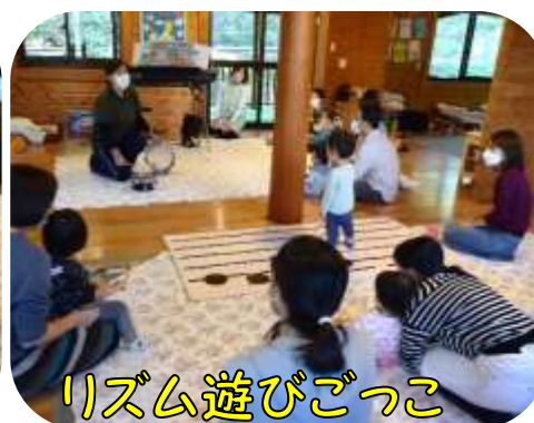
リズム遊びごっこ