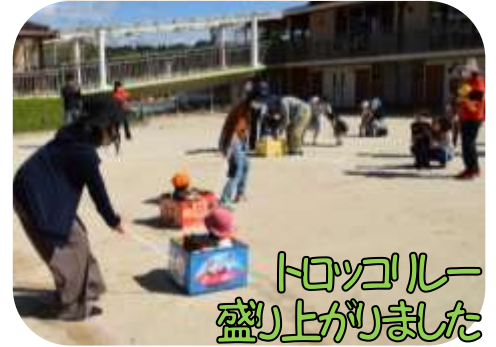
トロコルー 盛り上がりました