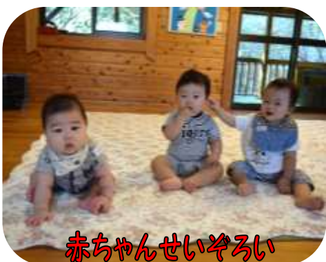
赤ちゃんせいぞろい