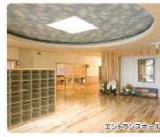
エンタンスホール